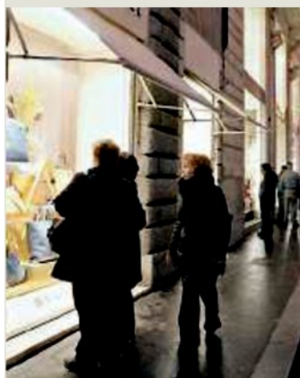
Pochi acquisti in Centro

Il Natale dei consumi nella Capitale «sarà peggiore del passato», con una sostanziale insoddisfazione dei commercianti per le iniziative prese dal Campidoglio per favorire la vivibilità e l'economia della Città eterna. Sono diverse le ombre che emergono dall'indagine «sul clima di fiducia delle imprese del terziario a Roma» dell'Osservatorio terziario di Confcommercio Roma. Il commissario Renato Borghi: «Ztl la domenica e pochi servizi danneggiano il centro storico».