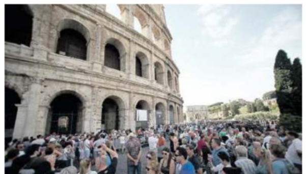
Il Colosseo, uno dei monumenti più visitati al mondo