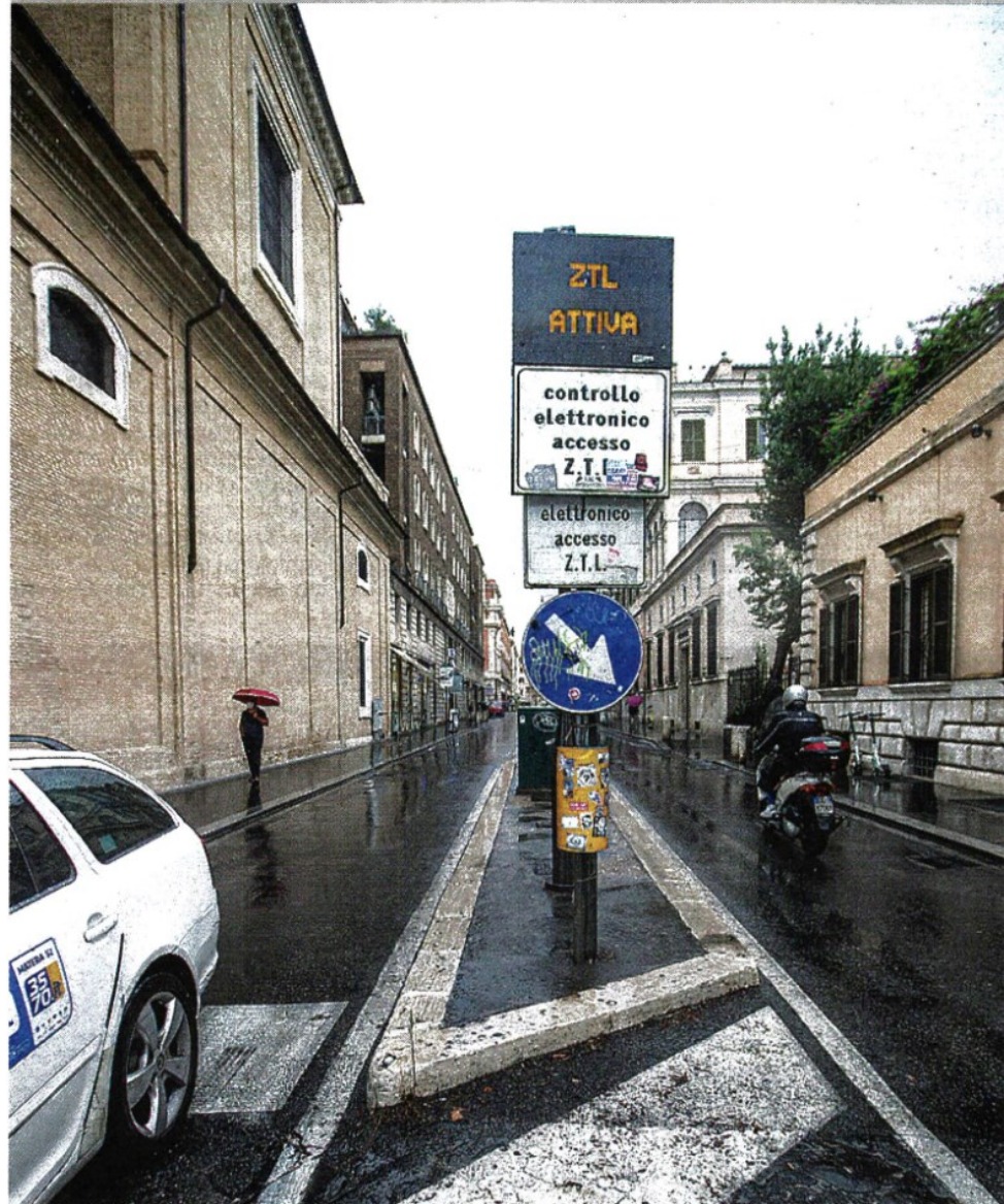
Il varco Ztl di nuovo attivo da ieri mattina in via Tomacelli